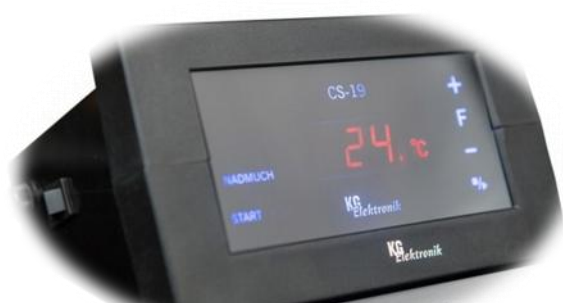
Obudowa montowana na kotle

Автоматика в разных видах корпусов для монтажа внутри и снаружи котлов