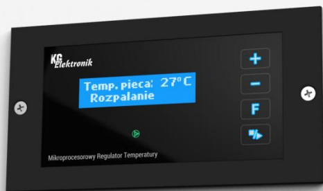
Obudowa do wbudowania